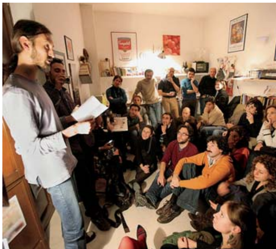
Oggi il nuovo appuntamento in casa Scarola, o in diretta radio su Bari Città Futura

Anche il lettore vuole quindi la sua parte: anche lui fa sistema e vuole fare sistema. A questo proposito, per dare risposte a questa domanda «dal basso», credo sia più opportuno dibattere, piuttosto che di una book commission, di una Casa delle Letterature. Una piattaforma che incoraggi la diversità di offerta editoriale che possa così raggiungere gruppi sociali più ampi. Che inoltre agisca da catalizzatore per progetti editoriali multiculturali e offra opportunità per scambi di idee tra editori, lettori ed autori. E non solo: una struttura che tiri fuori nuove leve di scrittori pugliesi che, per vedere pubblicata la propria opera dell'ingegno, non debbano rivolgersi necessariamente all'editoria a pagamento; una struttura che, in linea con quanto già avviene altrove in Europa, offra residenze artistiche agli autori.