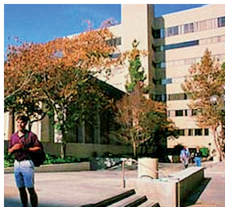
University of Southern California, Los Angeles